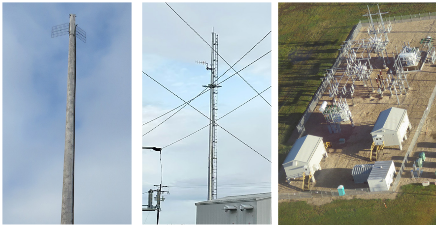
Le poteau de télécommunications existant se trouve à gauche.

Tous les travaux liés à ce projet, y compris l'utilisation potentielle de grues, auront lieu sur des terrains appartenant à AltaLink. Aucun accès à des propriétés privées ne sera requis.